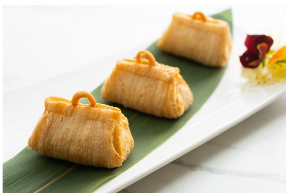
安格斯牛柳手袋酥