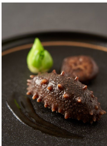
蔥燒八十頭關東遼參