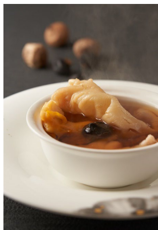
黑蒜螺頭燉花膠湯